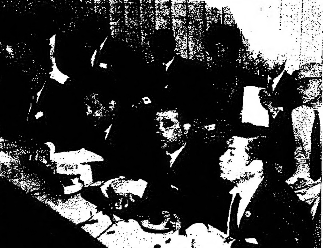
المرشد الاردني في اجتماع اللجنة القطرية والتشريعية في المؤتمر البرلماني الدولي في دكار بالسنغال خلال احد اجتماعات اللجنة.

وقال مسؤولون هنا ان المانيا الغربية كانت دائما على علاقات غير ممتدة مع تونس التي كانت بين ثلاث دول عربية تحتضن العلاقات الدبلوماسية مع تونس. وقال مسؤولون هنا ان المانيا الغربية كانت دائما على علاقات غير ممتدة مع تونس التي كانت بين ثلاث دول عربية تحتضن العلاقات الدبلوماسية مع تونس.